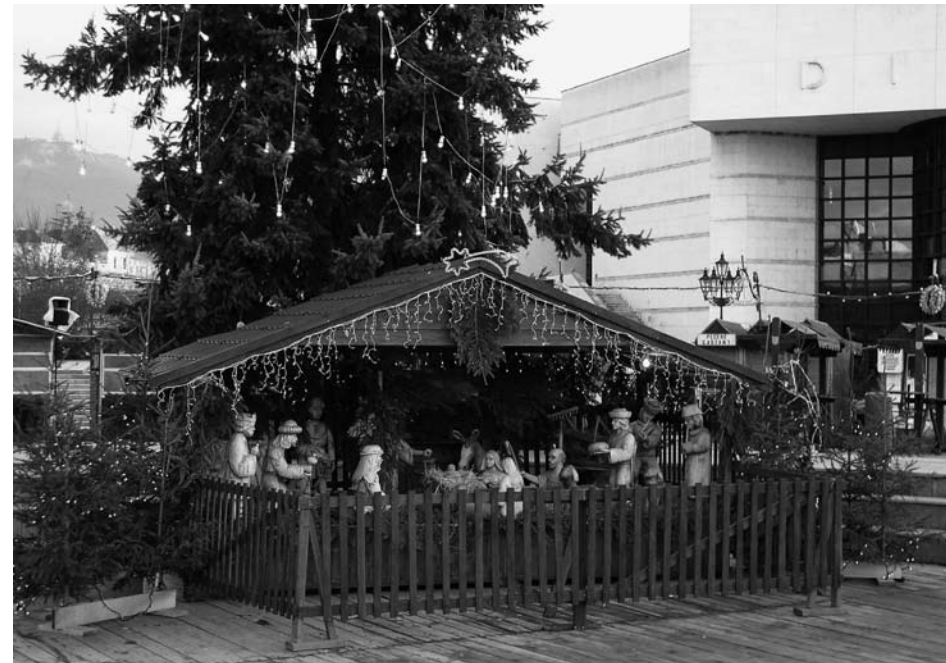
Kroky Nitranov povedú v týchto dňoch na Svätoplukovo námestie, kde sa rozprestiera krásny drevený Nitriansky betlehem.