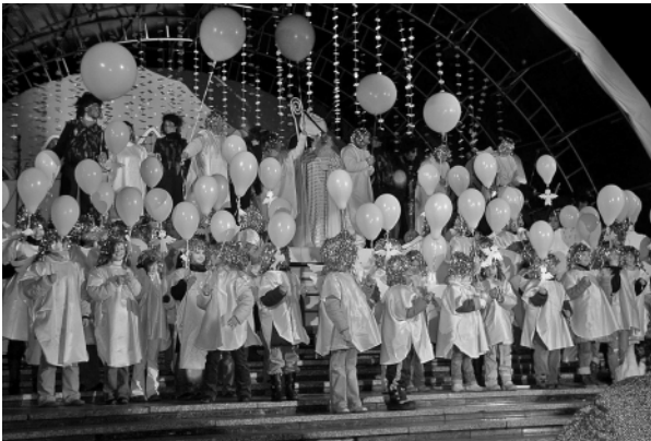
Viaňajší príchod Mikuláša sprevádzali aj anjelici.